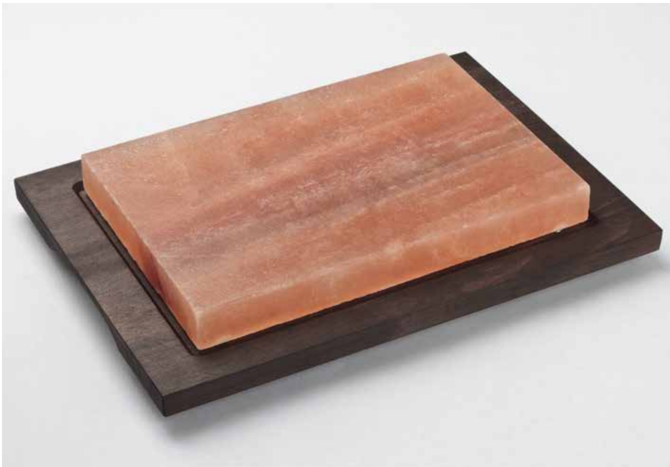
99314 Piastra sale rettangolare, base in legno color wengè (200 x 300 x 40 mm) Rectangular salt plate, wooden base wengè finishing (200 x 300 x 40 mm)