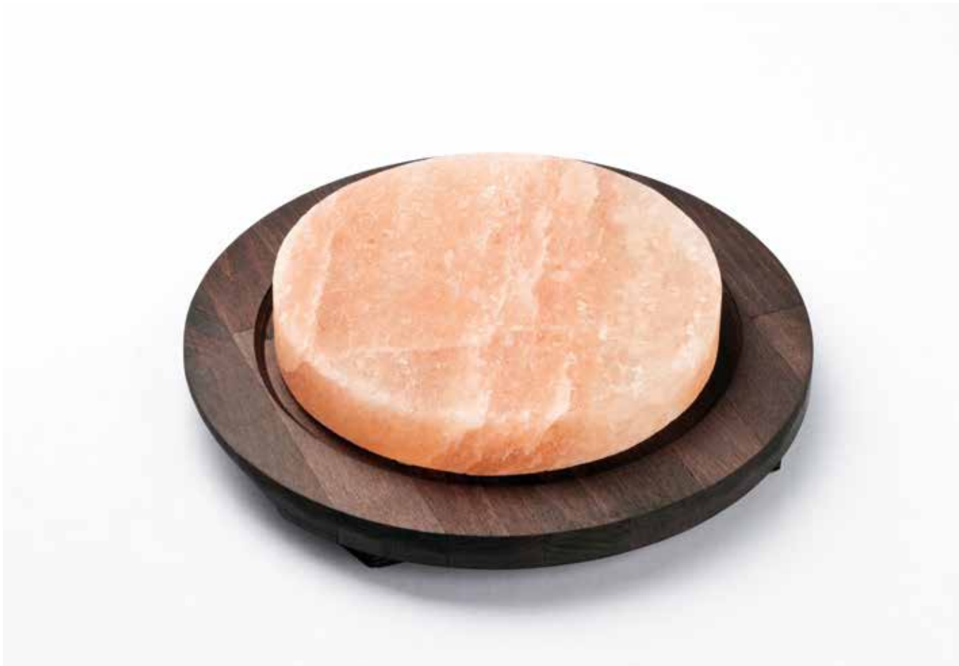
99311 Piastra sale tonda, base in legno color wengè (diam. 200 x 30 mm) Round salt plate, wooden base wengè finishing (diam. 200 x 30 mm)