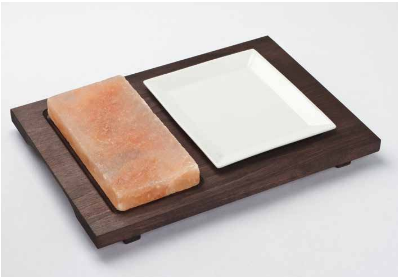
99356 Piastra sale rettangolare, base in legno color wengè con piatto in porcellana (200 x 100 x 30 mm) Rectangular salt plate, wooden base wengè finishing with porcelain dish (200 x 100 x 30 mm)