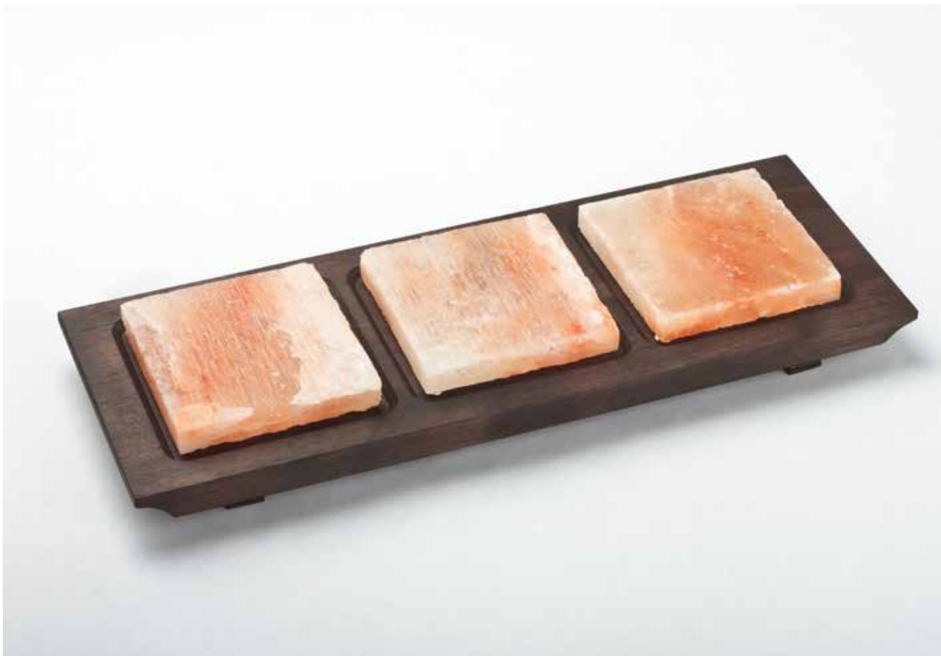
99358 Piastre sale quadrate, base in legno color wengè (100 x 100 x 15 mm) Square salt plates, wooden base wengè finishing (100 x 100 x 15 mm)